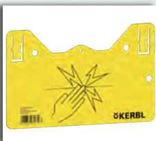
TABELLA DI AVVISO PER RECINTI ELETTRICI

In poliammide rinforzato con fibra di vetro. Possibilità di allentare facilmente la banda o il filo. Adatto per filo fino a Ø 8 mm e banda fino a h 40 mm.