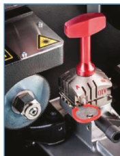
Stazione cifratura chiavi piatte e a croce

Futura Pro Unlimited è controllata da un tablet touch-passo nelle operazioni di duplicazione e incisione della chiave, rendendola la macchina perfetta per i duplicatori inesperti. Il software aiuta infatti a selezionare la corretta referenza di una