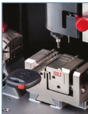
Cifratura chiavi laser