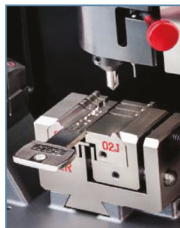
Cifratura chiavi punzonate

Futura Pro Unlimited è dotata di 2 porte USB sul retro: una per la ricarica completa della