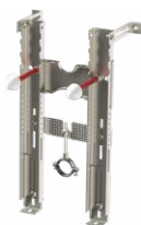
Configurazione PREMIUM per bidet