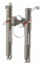
Configurazione PREMIUM per WC