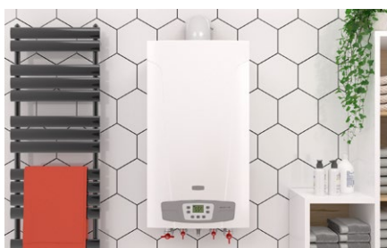
Scaldabagno a parete.