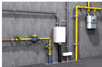
Fissaggio delle condotte