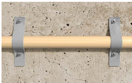
Fissaggio di tubi o cavi.