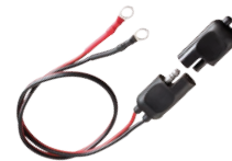
SM C70T 010136 Moto - Bike