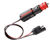
SM C36T - C70T 010135