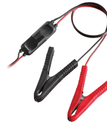
SM C36T - C70T